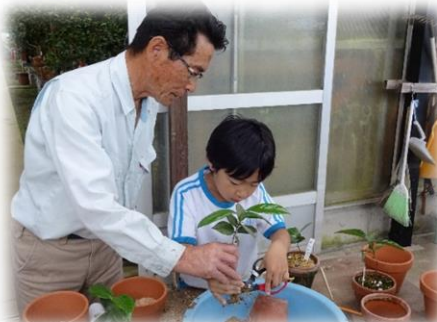
地域の達人から学ぶ「椿学習」