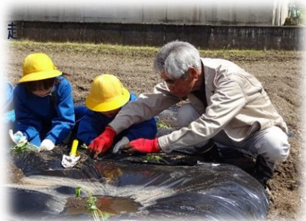
ふるさと学習「南砺学」

地域との関わりを大切にしながら、ふるさと南砺を誇りに思い、市の未来を担う人材育成に努めます。